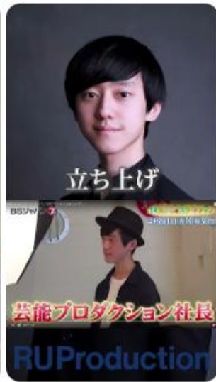
22歳で3社経営する社長！？ #shorts