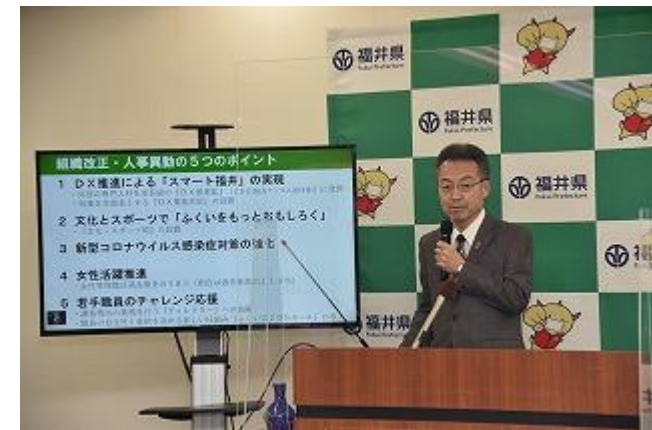
令和3年3月 知事記者会見