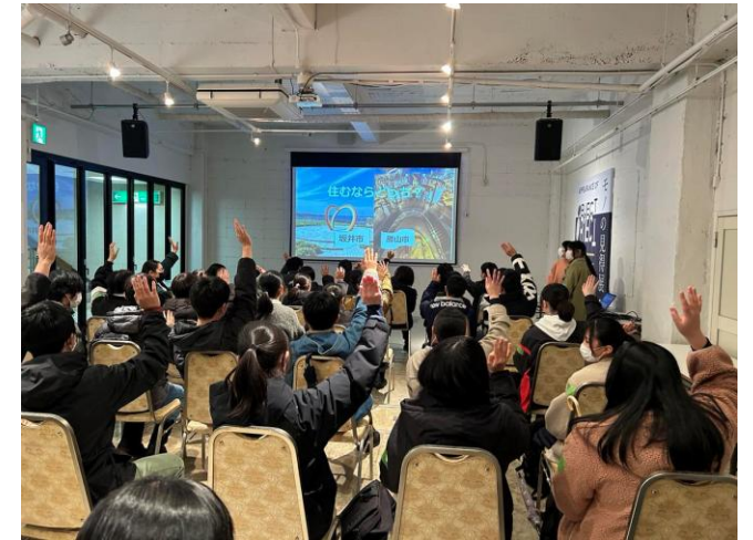
福井SMILEアクティ部の交流会