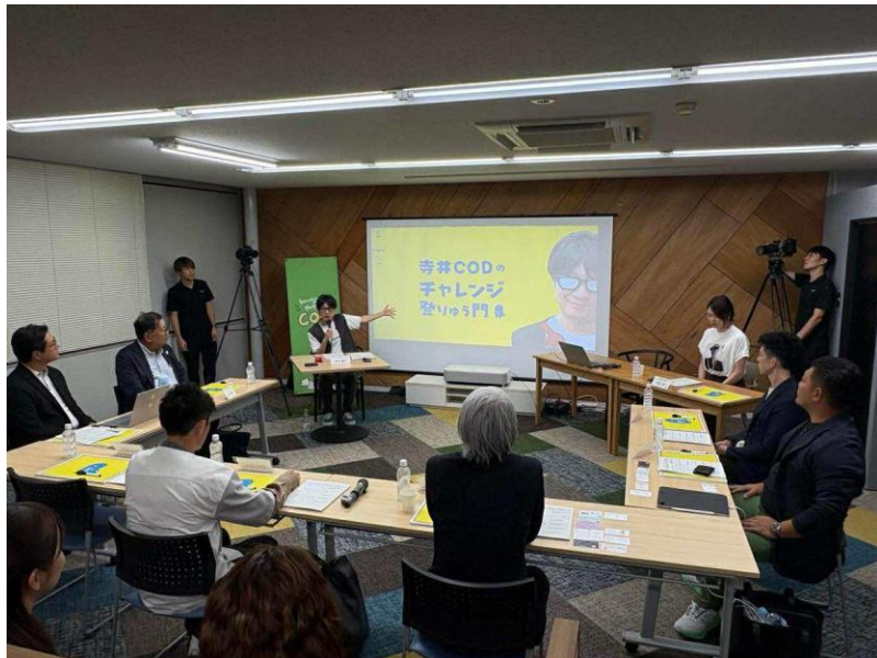
チャレンジ登りゅう門の様子