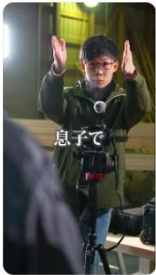
プロ必見大工動画の発案者！？ #shorts