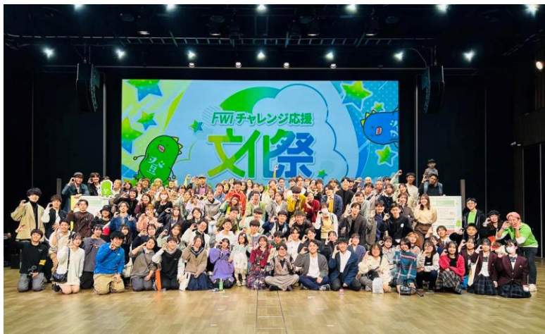
チャレンジ応援文化祭 【県内】