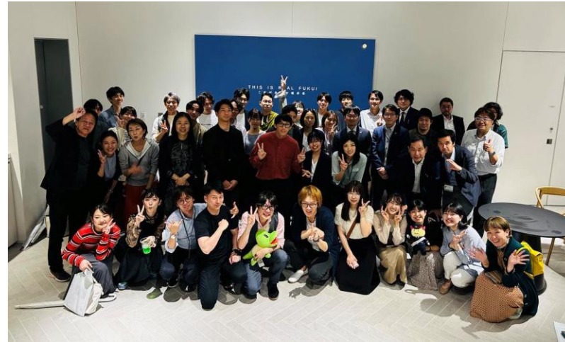
東京での若者を集めた交流会 【県外】