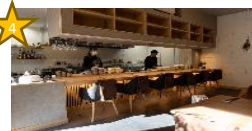
中華ビストロ 太一 (中華料理)