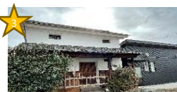
d'omaine de arai (フレンチレストラン)