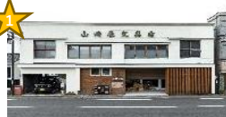
コモドデザイン・估謨堂 (設計事務所、雑貨販売)