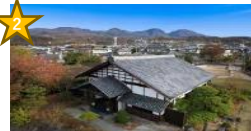
KOMORO HONJIN OMOYA (イタリアン)