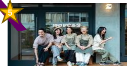
NOVELS & 蒼空 (ブックカフェ&ゲストハウス、ピザ・イタリアン)