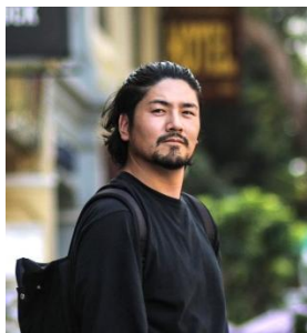
日高 慎一郎 Hidaka Shinichiro フォトグラファー