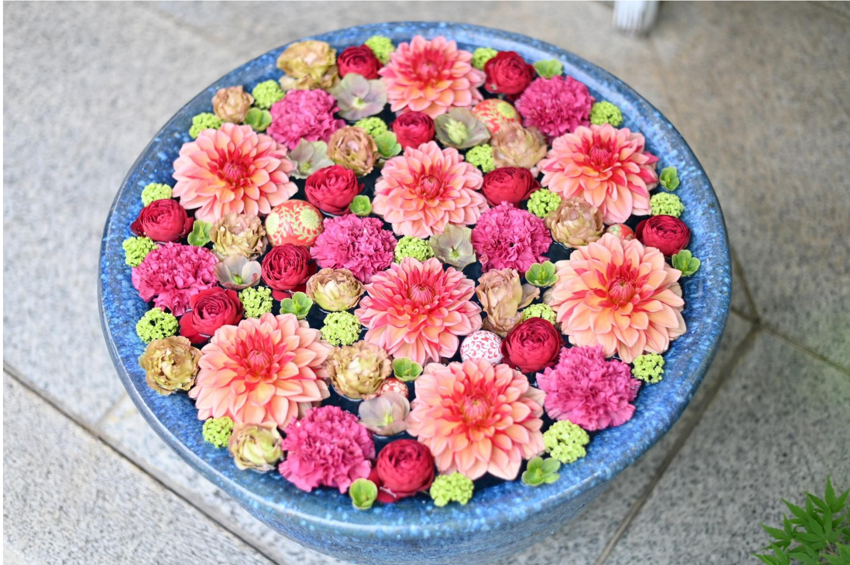
手水舎に見たてた水鉢に花を浮かべたもの