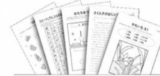
ベクトル発見プリント