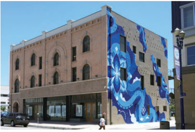
過去に制作した作品(米国カリフォルニア州ロングビーチ市、2016年)

中央区のラブラ万代前の地下通路「万代クロッシング」で、ストリートアートを展示します。