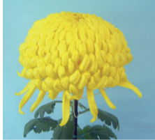
大会記念競技花「新潟の金華」