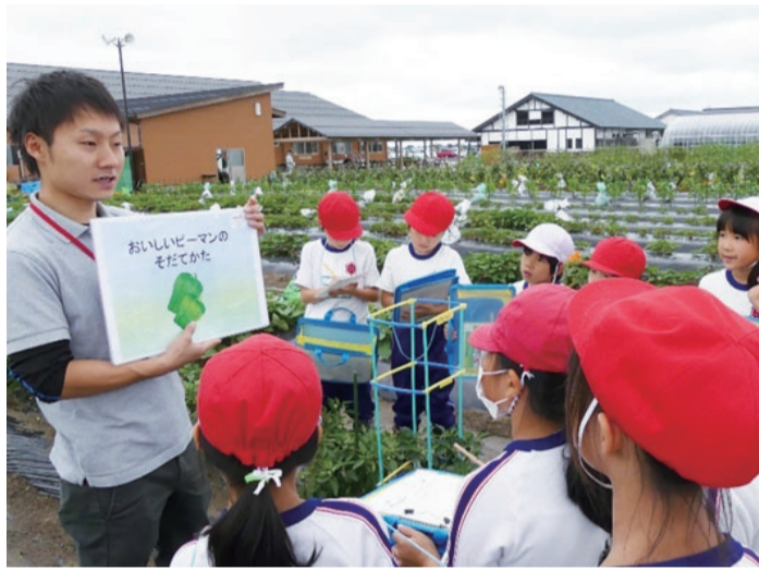
アグリパーク(南区)で野菜の育て方を学ぶ子どもたち

本市独自の取り組みである「新潟発 わくわく教育ファーム」が、「プラチナ大賞」において「優秀賞」を受賞しました。「プラチナ大賞」は、人口減少や高齢化などの地域課題の解決や、新たな可能性の創造に向けて、先進的な取り組みをしている自治体や民間企業を全国から募集し、表彰するもの。10月26日に都内で行われた最終審査と表彰式では、農業と教育が融合した取り組みで成果が出ており、事業の継続性が高い点などが高く評価されました。