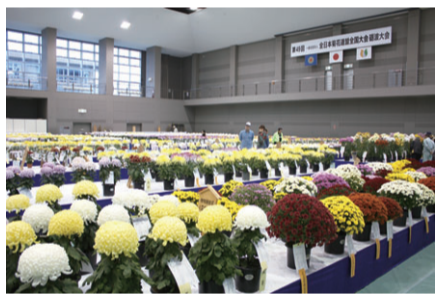
過去の大会の様子

これは菊づくりの普及と栽培技術の向上を図るため行うもの。全国の菊愛好者約700人が育てた切り花や鉢、盆栽約2,000作品を一堂に展示し、優雅さを競い合います。